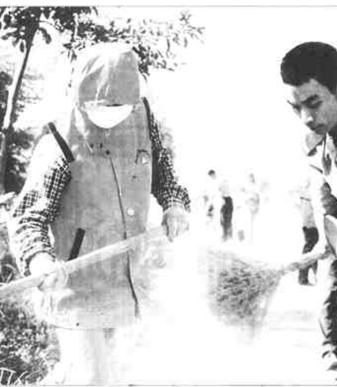
中国包装技术协会建材包装委员会四届一次常委会议在我市召开。