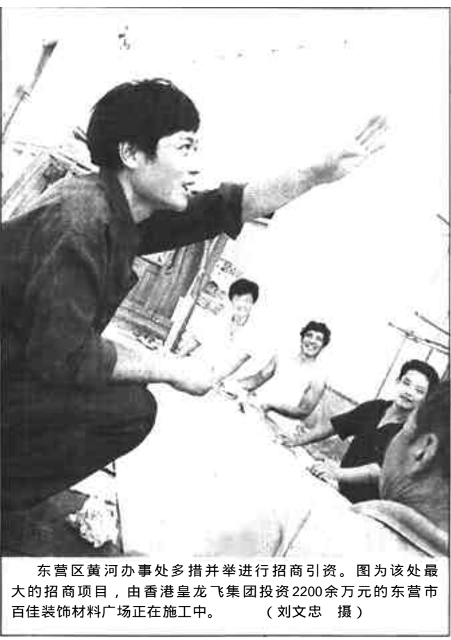
东营区黄河办事处多措并举进行招商引资。图为该处最大的招商项目，由香港皇龙飞集团投资2200余万元的东营市百佳装饰材料广场正在施工中。

广饶讯 近两个月以来，广饶镇计生办掀起了计生服务宣传“六到家”活动热潮。这“六到家”是：产后、术后、药具随访服务到家；为病残妇女免费健康体检到家；为移民免费建档、查体、咨询服务到家；宣传避孕节育措施知情选择到家；发放宣传材料到家；宣传中央《关于加强人口与计划生育工作稳定低生育水平的决定》和“七个不准”到家。（毛士芳）